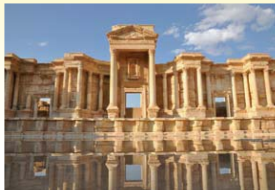
La "mia" Palmira

via Marconi 113 - tel. 339.8959081 associazione.postumia@hotmail.com