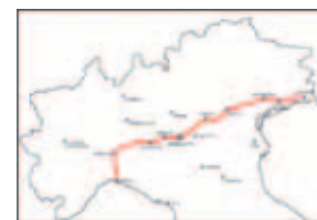
La Via Postumia