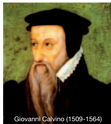
Giovanni Calvino (1509-1564)

"Nulla ho scritto per odio contro qualcuno, ma ho sempre proposto fedelmente ciò che ho creduto potesse servire alla gloria di Dio" (dal discorso d'addio ai ministri di Ginevra, 1564).