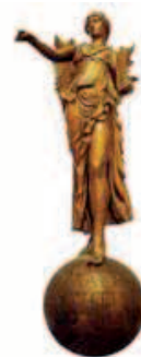
La Vittoria di Calvatone