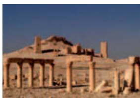
Palmira, Siria - scavi.

Venerdì 19 marzo, ore 20.45 - Gazoldo, Villa Ippoliti - MAM